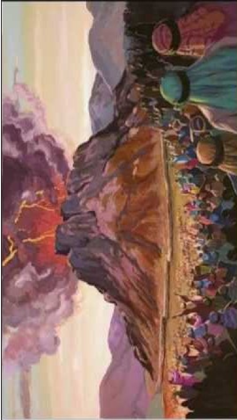
Iglesia del Dios Vivo Columna y Apoyo de la Verdad "El Buen Pastor" Comisión para la Educación Cristiana de la Niñez y Adolescencia (C.E.C.N.A) Programa de Educación Sistemática